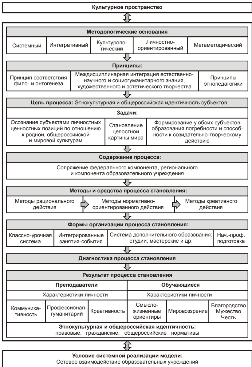
Рис. 3. Этнорегиональная модель образовательного процесса в учреждениях Северного Кавказа.